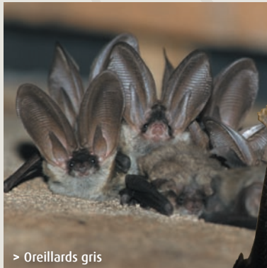
> Oreillards gris

Les chauves-souris sont les seuls mammifères capables d'un vol actif. L'aile est une main qui s'est transformée et dont les longs doigts sous-tendent une membrane de peau souple et élastique. Ces mammifères nocturnes font partie des rares animaux qui peuvent "voir avec leurs oreilles" : ils chassent et s'orientent dans l'obscurité en utilisant les échos de leurs cris ultrasonores.