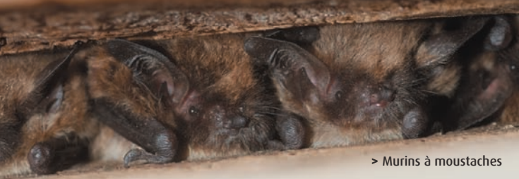
> Murins à moustaches