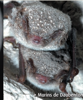
> Murins de Daubenton