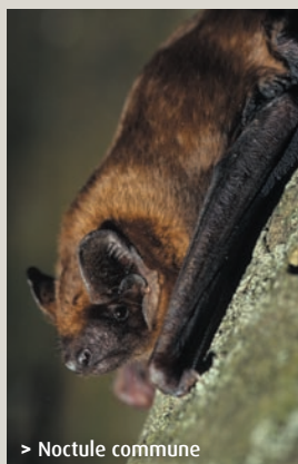
> Noctule commune

Préservez les terrains de chasse des chauves-souris (haies, vergers traditionnels, prairies de pâture, rivières bordées d'arbres...) ainsi que les gîtes où elles hibernent et se reproduisent (vieux arbres, combles, grottes...). Vous pouvez y contribuer, notamment en participant à l'opération "Refuges pour les chauves-souris" qui consiste à promouvoir l'installation et le maintien de ces petits mammifères dans les bâtiments et les jardins. Plus d'infos sur l'opération sur www.sfepm.org/refugepourleschauvessouris.htm