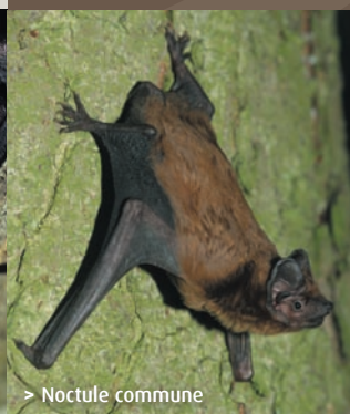
> Noctule commune