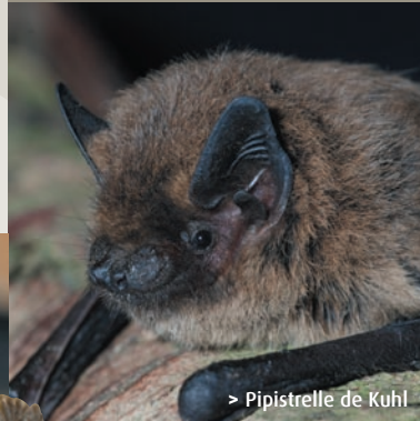
> Pipistrelle de Kuhl

En Europe, toutes les chauves-souris sont essentiellement insectivores. Dès le soir, elles prennent le relai des oiseaux et peuvent consommer en une nuit près de la moitié de leur poids en insectes variés, tels les moustiques, les mouches ou encore les papillons de nuit dont beaucoup de chenilles se développent aux dépens des cultures. Elles sont donc très utiles !