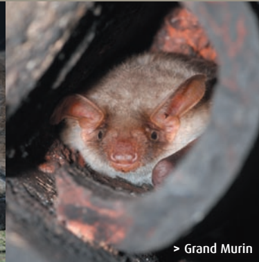
> Grand Murin